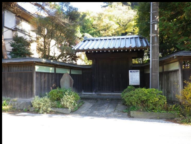
現在の小島家(小島資料館)